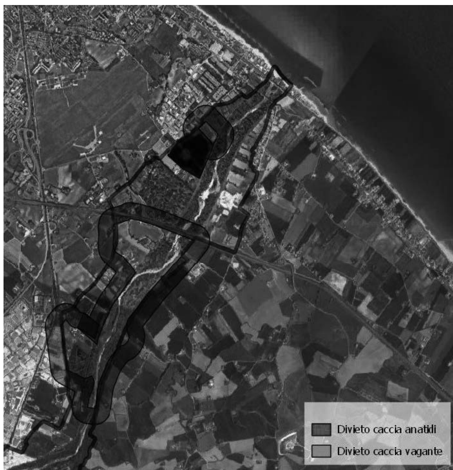
Figura 1 – Ambiti di divieto di caccia agli anatidi e in forma vagante